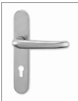
DOPORUČENÝ TVAR KOVÁNÍ